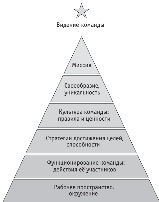
Рис.1. Пирамида логических уровней.

ностей. Что отличает вашу команду от остальных? Какими характерными чертами она обладает? Как при помощи названия показать нацеленность вашей команды на успех, выделить её на фоне остальных? «Как вы яхту назовёте, так она и поплывёт». Если название уже было придумано, оцените его с точки зрения вновь полученной информации, возможно, стоит его трансформировать? Сделайте эмблему, логотип команды, отражающей её название и миссию.